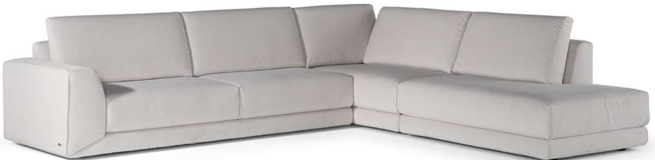
■ Vers. 018+032+073