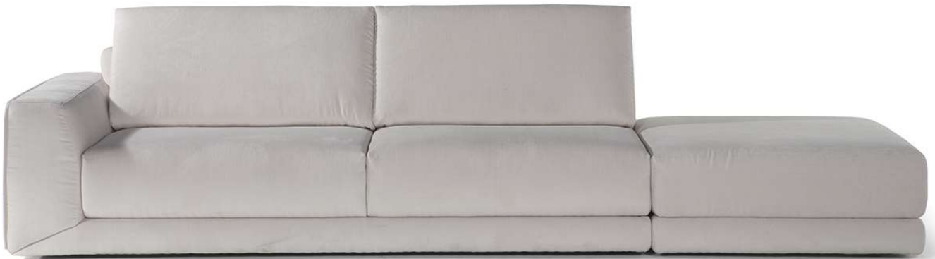
■ Vers. 018+100