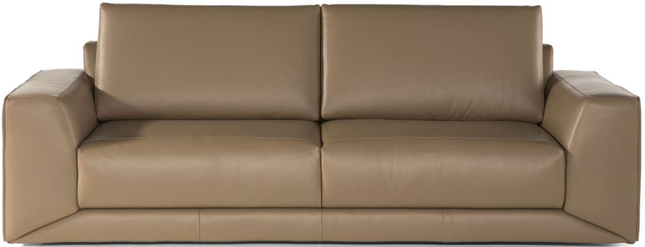
■ Vers. 009