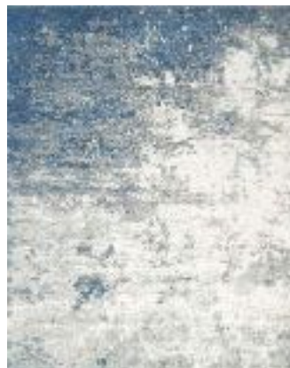
■ R86903X • Sky