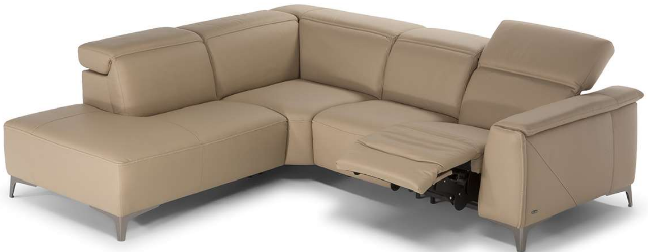
■ Vers. 072+489+001+N02