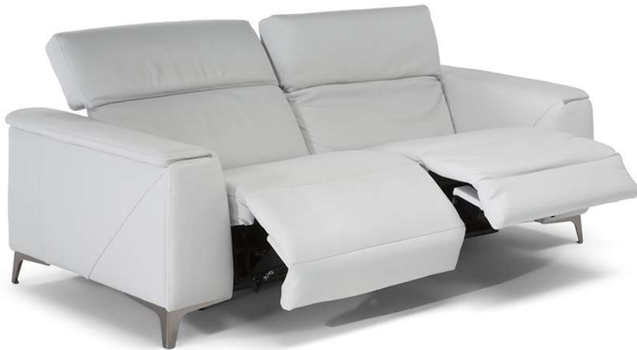
■ Vers. N46