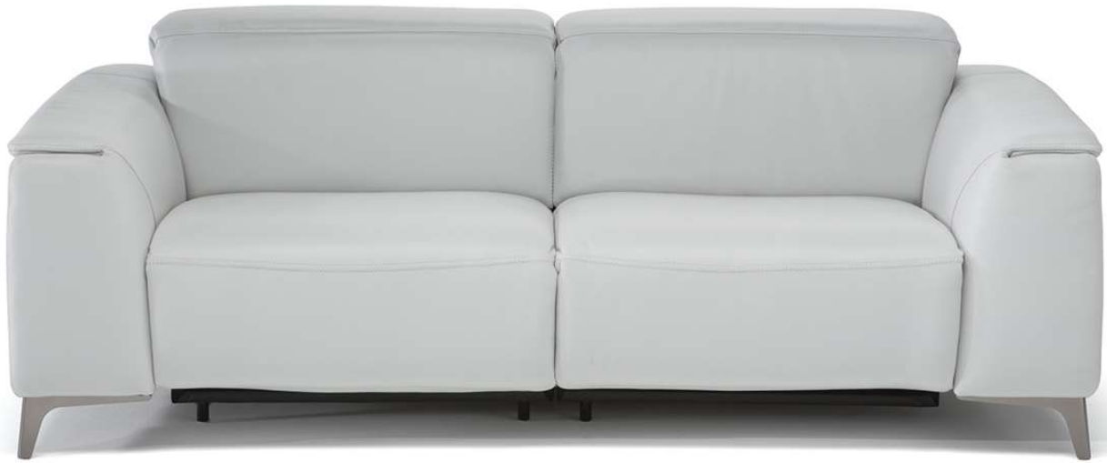
■ Vers. N46